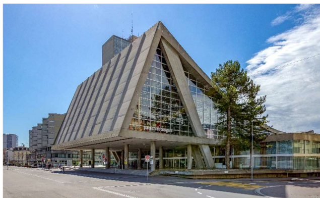
Palais des Congrès de Bienne © CTS Bienne

Lieu CTS - Palais des Congrès de Bienne Rue Centrale 60, CH-2501 Bienne, Tél. +41 32 329 19 19 www.ctsbiel-bienne.ch