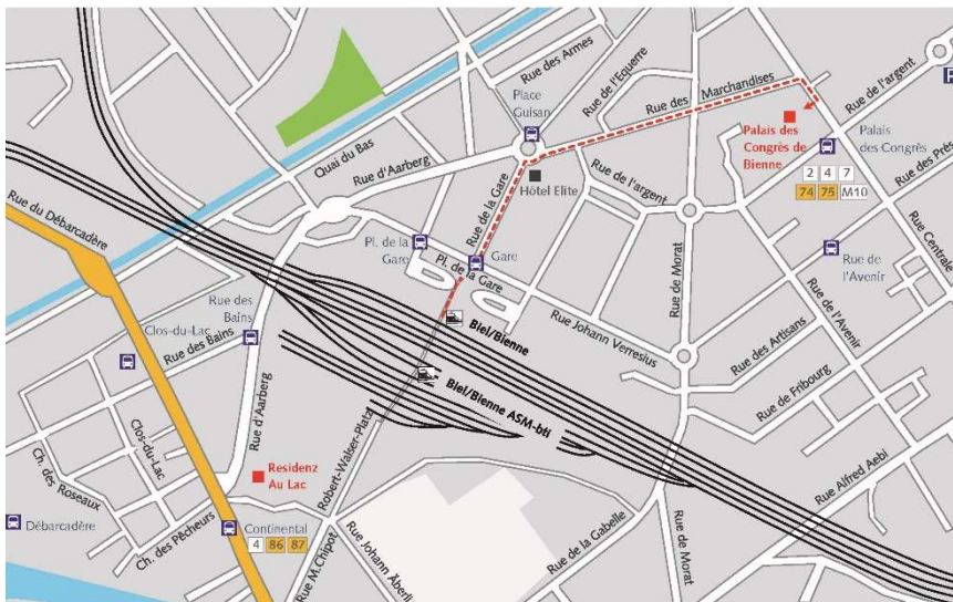
Plan de situation Bienne

En transports publics 10 minutes à pied de la gare de Bienne; suivre la Rue de la Gare jusqu'à l'hôtel Elite, tourner à droite dans la Rue des Marchandises, puis toujours tout droit jusqu'à la Rue Centrale.